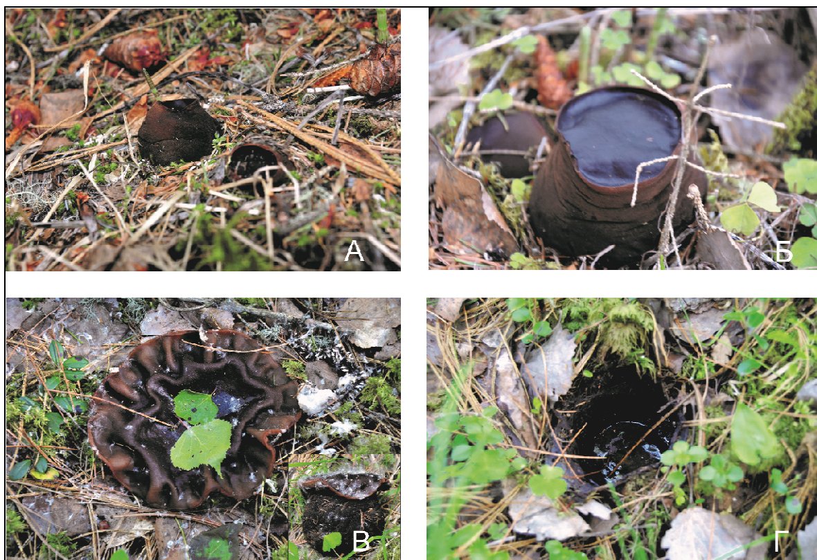
Рис. 4. Развитие плодовых тел S. globosum : А: середина-конец мая, Б: начало-середина июня, В: конец июня, Г: начало-середина июля.