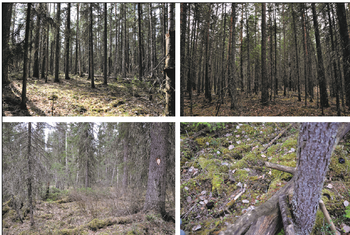
Рис. 3. Типичные местообитания S. globosum в заповеднике «Юганском» и окрестностях: дренированные (вверху) и переувлажненные (внизу). В заболоченных местах плодовые тела тяготеют к выпуклым элементам микрорельефа (внизу справа).